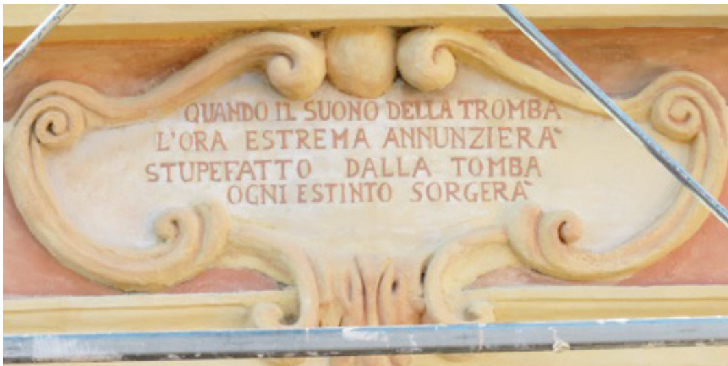
Ripristino dell'epigrafe contenuta all'interno del cartiglio sovrastante la chiave di volta della porta di ingresso della chiesuola.