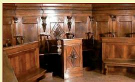
CHIESA SAN GIOVANNI BATTISTA - CAMISANO

La Lusardi Restauri svolge l'attività di restauro in edifici antichi e chiese, e per conto di privati, poli museali, Comuni, Soprintendenze e Curie diocesane. Si effettuano risanamenti conservativi di arredi antichi e sacri, restauro di dipinti e laccature policrome, recupero e ripristini di portali, soffitti e apparati lignei. Si realizzano policromie, dorature e lavori di ebanisteria ed intaglio.