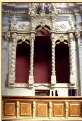
CHIESA SAN BENEDETTO - CREMA

Laboratori: via E. Conti, 2 - Bolzone - Ripalta Cremasca (Cr) - via M. Polo, 17 - Bolzone - Ripalta Cremasca (Cr) Uffici amministrativi: via Vittorio Veneto, 1/i - 26010 Ripalta Cremasca (Cr) Tel 0373 258644 - Fax 0373 81218 - info@lusardirestauri.it - www.lusardirestauri.it