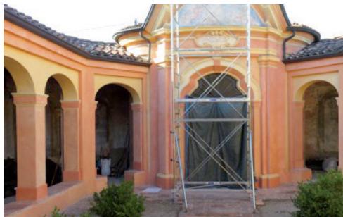
Interno del tempietto