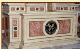
CHIESA SS. NOME MARIA - CRESPI D'ADDA